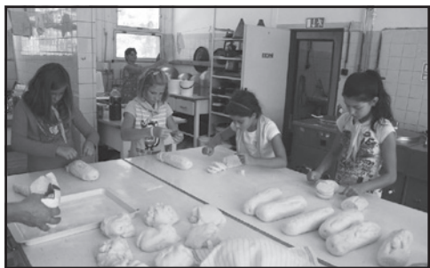
Čerstvé chutné jídlo připravujeme pětkrát denně